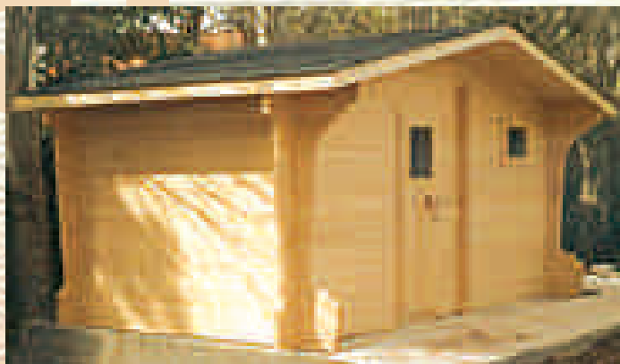
Mod. J-4-T, versión tablón