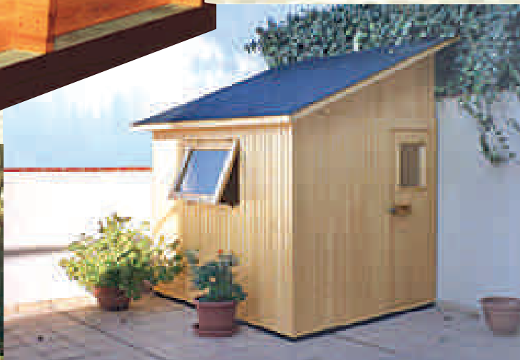
Mod. J-2-A, versión aislada