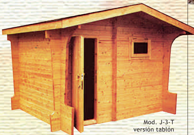
Mod. J-3-T versión tablón